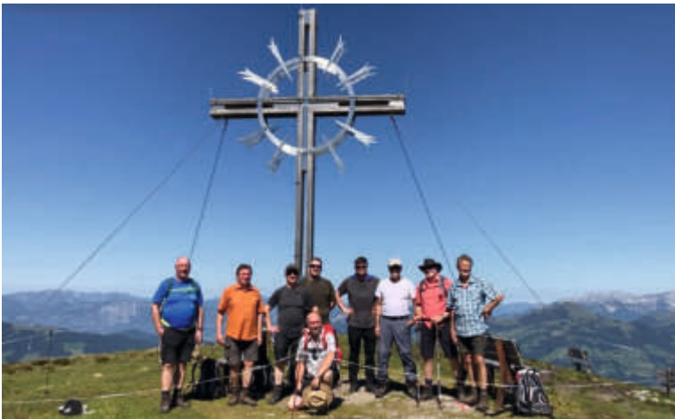
Der Höhepunkt der Wanderwoche 2023 war die Besteigung des Lodron auf 1925 Meter über NN. Wir wanderten 1200 Höhenmeter an diesem Tag.